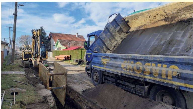
Nesvady - kanalizácia