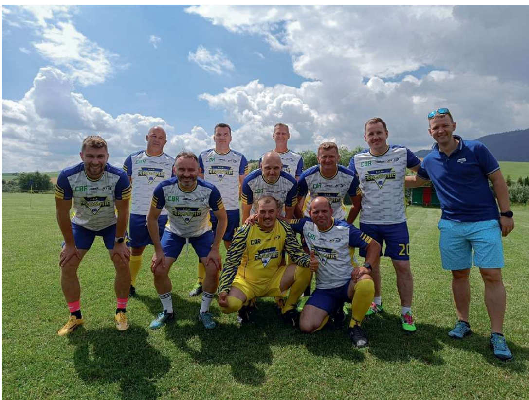
futbalový tím "výber EKO SVIP"