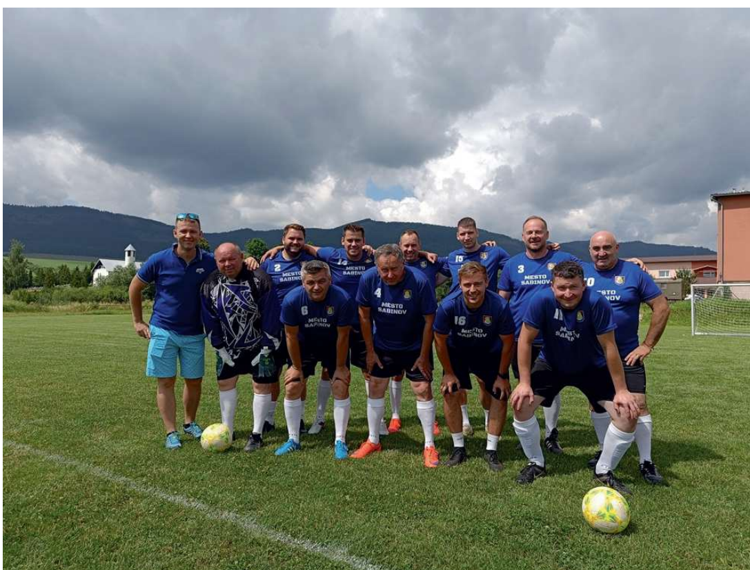
futbalový tím "výber starostovia a primátori"