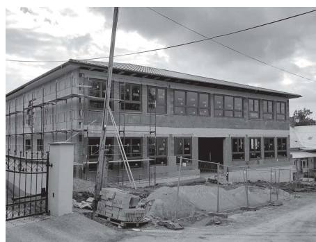
"Výstavba základnej školy v obci Boliarov – odstránenie dvojzmennej prevádzky"