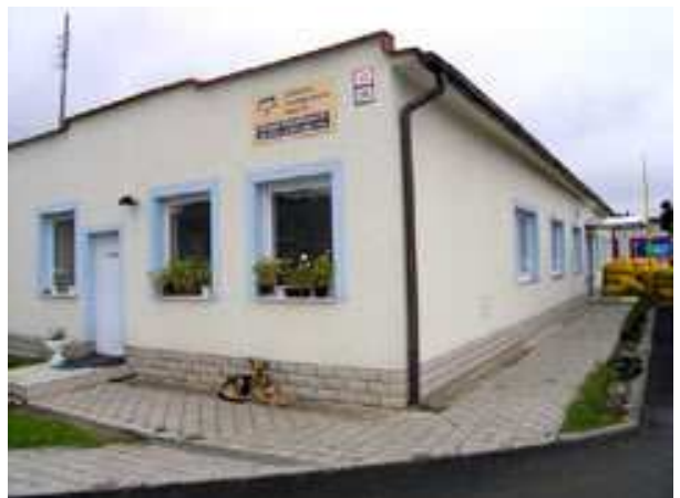
Obr. Niekdajšia administratívna budova Ovocinárska 48, Sabinov, pred a po rekonštrukcii