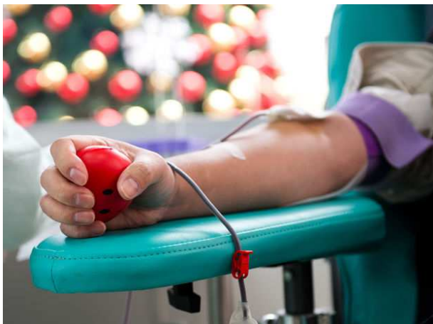
Ilustračné foto: zdroj: zdravie.pravda.sk

Tentokrát sme krv darovali v Kultúrnom centre na korze dňa 24.2.2016 v Sabinove, ktoré sa konalo v rámci celoslovenskej Valentínskej kvapky krvi. Tá trvá od 8.2.2016 do 11.3.2016 a nesie krásny podtitul: „Príďte sa rozdat' pre druhých“.