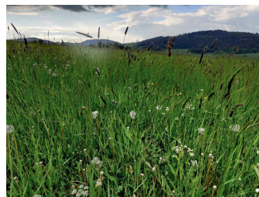
V lúčoch slnka zapadajúceho za horizont sa zrkadlí nový deň.