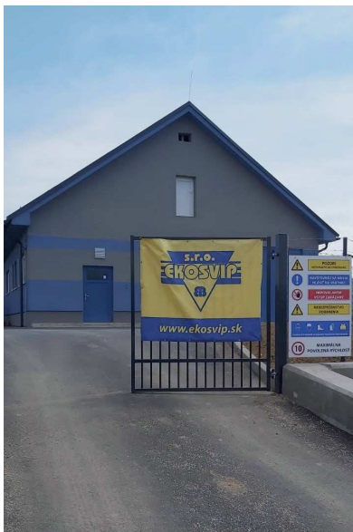
"ČOV Nitrianske Pravno"