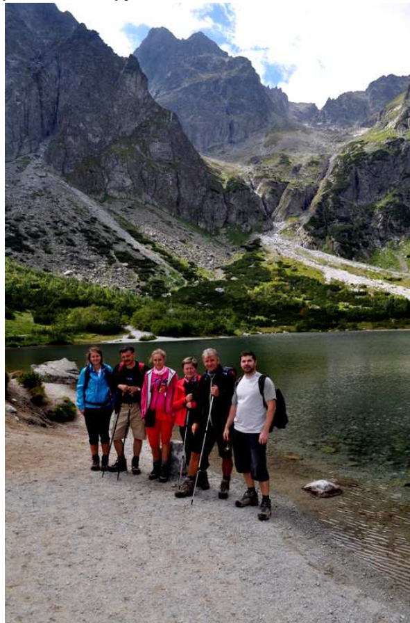
foto: pri Zelenom plese