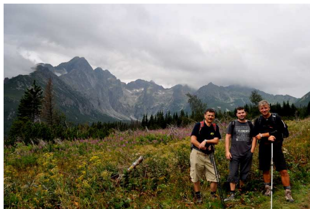
foto: na Rakúskej poľane

Našou turistickou prípravou na Risy bola nenáročná trasa, ktorá však rozhodne patrí medzi najkrajšie v Tatrách: Tatranská Kotlina – Chata Plesnivec – Biele Pleso – Chata pri Zelenom plese – zastávka Biela voda.