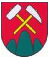
„Kanalizácia a ČOV Bretka“

V mesiaci september po úspešnej júlovej elektronickej aukcii bola podpísaná zmluva o diela medzi verejným obstarávateľom Obec Bretka a našou spoločnosťou.